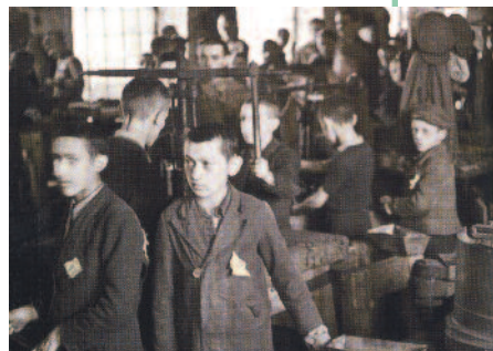
Bambini al lavoro nel Ghetto