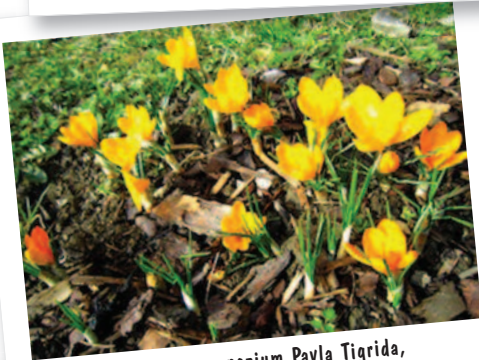
Jazykove gymnazium Pavla Tigrida, Repubblica Ceca