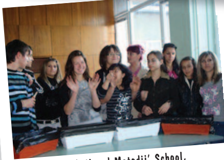
St Kiril and Metodii' School, Bulgaria