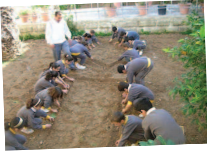
Xewkija P.S., Malta