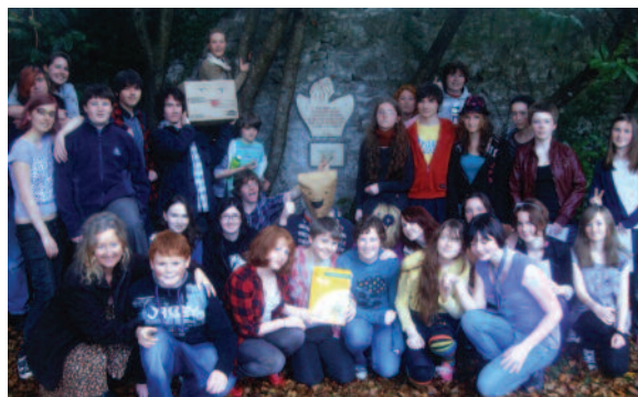
Gruppo Giovanile di Clare, Irlanda

I crocus si moltiplicano di anno in anno. Con l'aumentare della partecipazione dei bambini di tutto il mondo nel piantare i bulbi, il numero di fiori aumenta. Alla fine ci saranno più di un milione e mezzo di crocus che fioriranno in varie parti del mondo in memoria dei bambini che morirono nell'Olocausto.