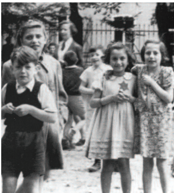
Ghetto di Theresienstadt, oggi Repubblica Ceca: gruppo di bambini con la Stella di Davide

Durante gli anni trenta, i Nazionalsocialisti, meglio conosciuti come Nazisti, dicevano che potevano risolvere i problemi della Germania. Guadagnarono grande popolarità e formarono un governo nel 1933. Il loro leader era Adolf Hitler. Il periodo dal 1933 al 1945 è spesso definito 'l'era nazista'.