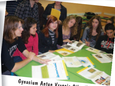
Gynasium Antun Vrancic Sibenik, Croazia