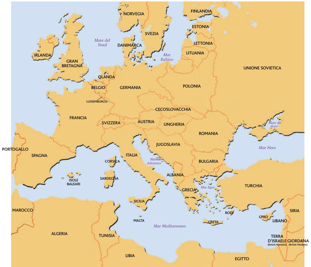
Mappa dell'Europa, 1930 circa