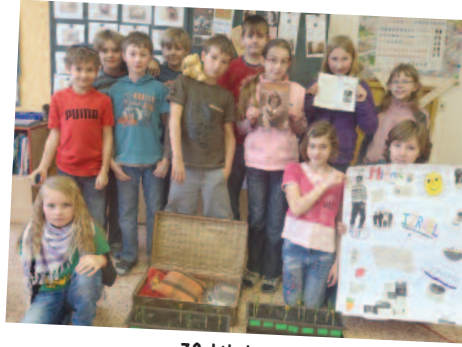
ZS Libchavy, Repubblica Ceca