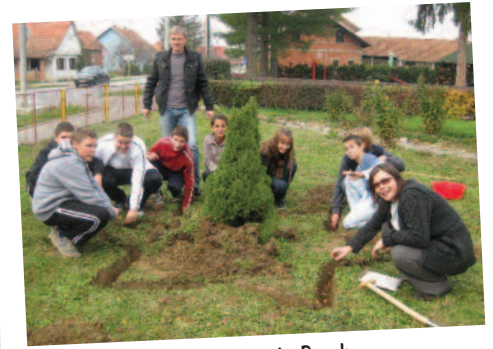
Scuola primaria Berek, Croazia