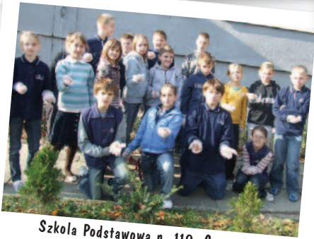
Szkola Podstawowa n. 119, Cracovia, Polonia