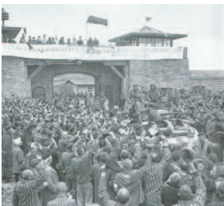
Truppe americane liberano Buchenwald

1944 Deportazione di Ebrei ungheresi Anne Frank e la sua famiglia sono deportati ad Auschwitz