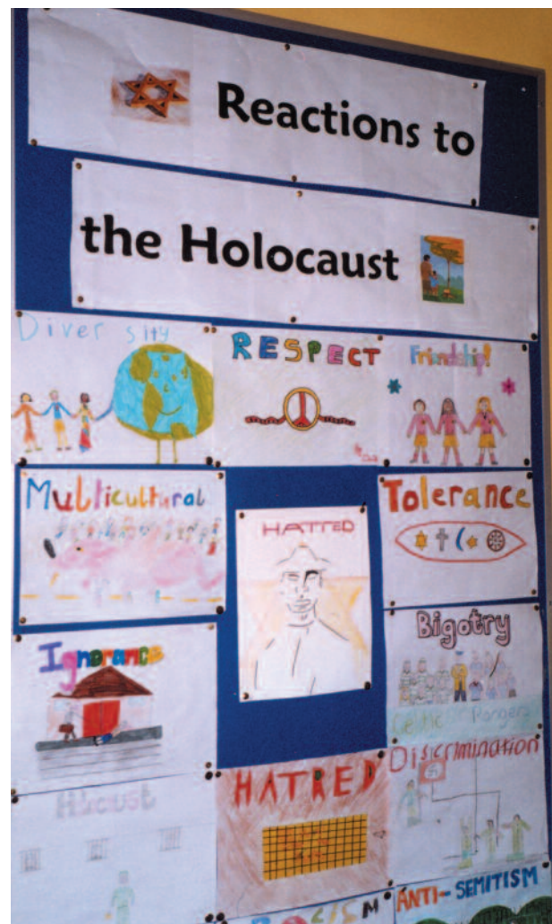
Spiegare parole chiave, Rathgar Junior School, Dublino, Irlanda.

Valutate la lista delle parole chiave positive e negative. Discutete alcune delle parole. Ideate attività che chiariscano le parole e ne facilitino la comprensione.