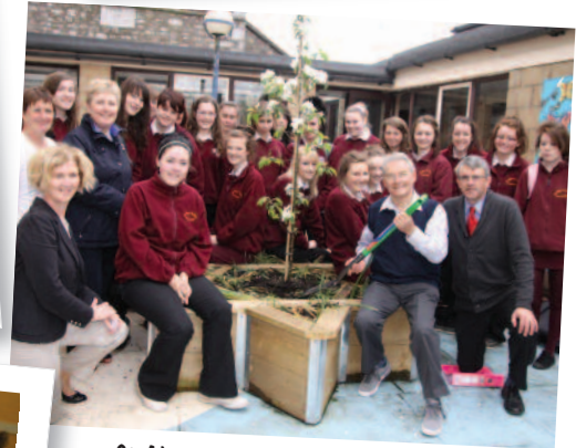
St Aloysius College, Carrigtwohill, contea di Cork, Irlanda