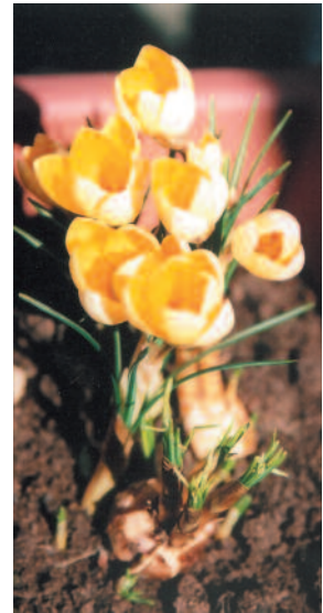
Crocus in fiore piantati dagli allievi del Kilkenny School Project, Springfields, Kilkenny, Irlanda

Alla fine speriamo che bambini di tutto il mondo planteranno crocus gialli in memoria di tutti i bambini che morirono nell'Olocausto