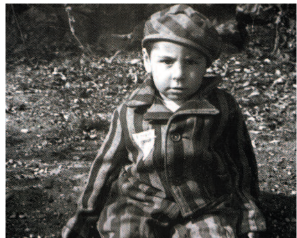
Bambino in tenuta da carcerato, 1945