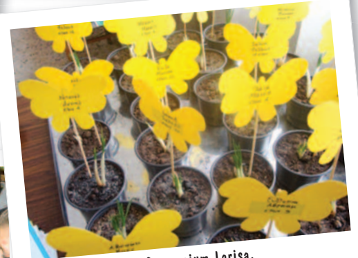
1o Gymnasium Larisa, Grecia