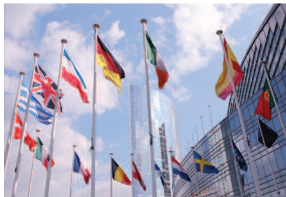
Bandiere dei paesi membri dell'UE fuori dalla sede centrale dell'UE a Bruxelles, Belgio

I cittadini dell'UE condividono valori europei fondati sui diritti dell'uomo e il principio di legalità. La tolleranza e il rispetto per tutti i cittadini a prescindere dalle loro differenze culturali sono principi fondamentali dell'Unione Europea.