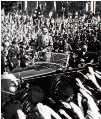
Adolf Hitler con folle acclamanti

Compilate una cronologia dal 1933, quando i nazisti salirono al potere, fino alla fine della seconda guerra mondiale nel 1945. Aggiungete altre informazioni e illustrazioni alla vostra cronologia.