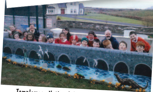
Templemary National School, contea di Mayo, Irlanda