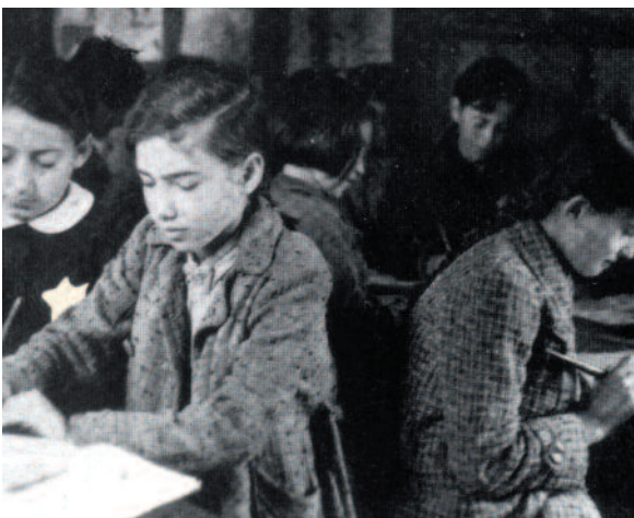
Bambine in classe, Ghetto di Kovno

È molto importante che non dimentichiamo questo periodo terribile della storia europea fra il 1933 e il 1945. Dobbiamo assicurarci di non permettere a nessun individuo o gruppo di persone di uccidere o fare del male ad altri perché non ci piacciono o non si è d'accordo con le loro idee.