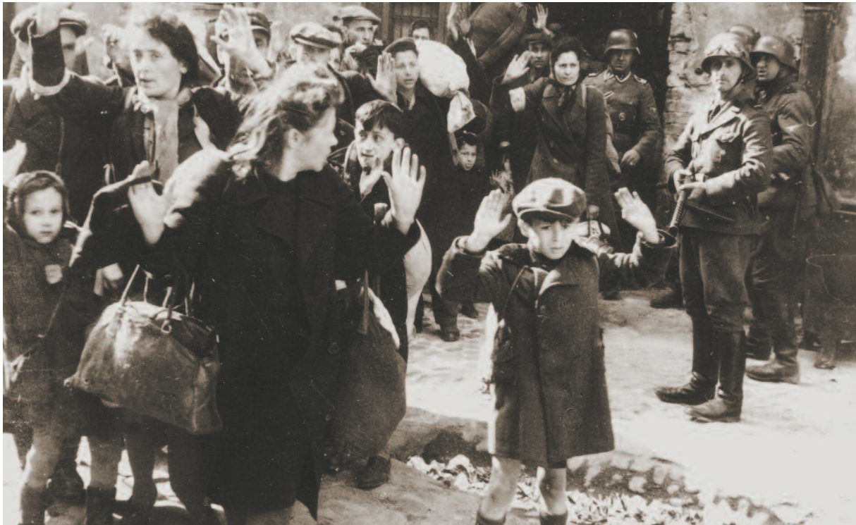
Bambino polacco

Dopo la sua sconfitta nella prima guerra mondiale (1914-1918), la Germania si ritrovò con molti problemi economici e sociali. Migliaia di persone pativano la fame ed erano senza lavoro. I tedeschi speravano che i loro leader politici avrebbero risolto i loro problemi.