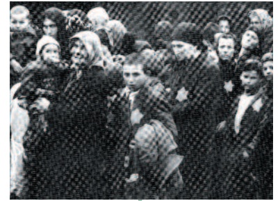
Ebrei ungheresi arrivano ad Auschwitz

La Germania invade la Polonia, inizio della seconda guerra mondiale