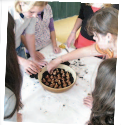
ZS Jilove, Repubblica Ceca