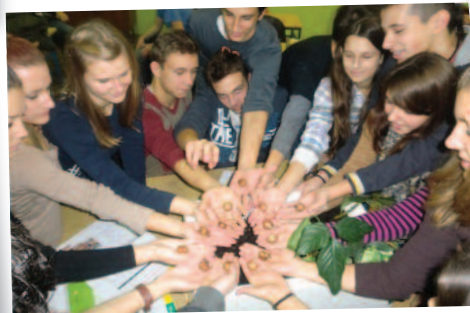
Scuola secondaria Mate Blazine Labin, Croazia