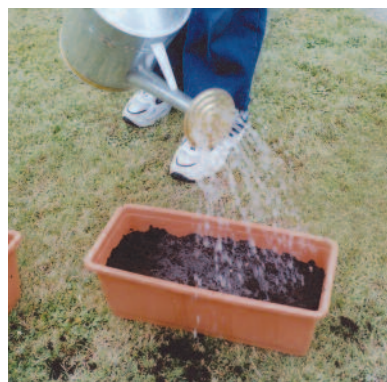
Amici della fondazione mentre piantano bulbi