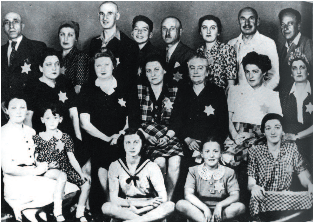
Famiglia ebrea nel ghetto di Budapest, 1944

Alla fine speriamo che bambini di tutto il mondo planteranno crocus gialli in memoria di tutti i bambini che morirono nell'Olocausto