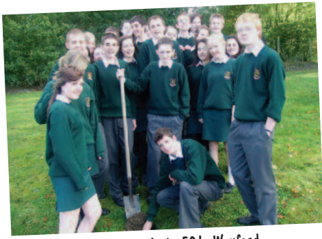
Scuola secondaria FCJ, Wexford, Irlanda