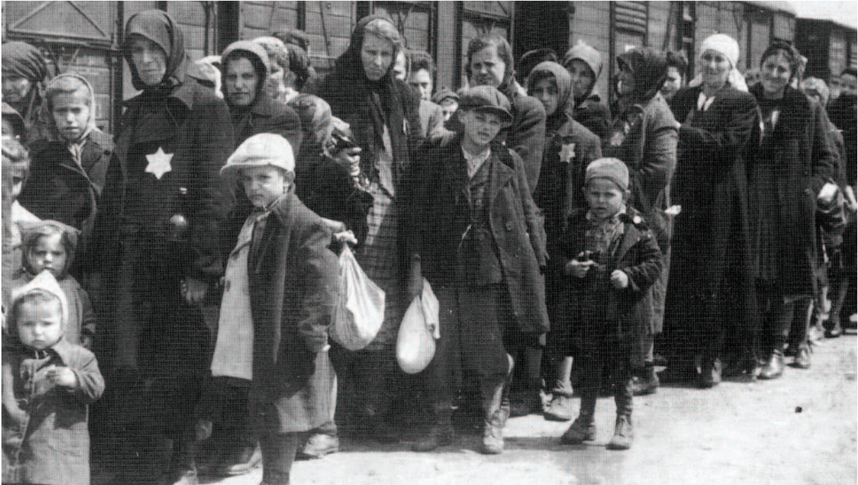
Ebrei in arrivo davanti a vagoni ferroviari

I nazisti mandarono famiglie ebreiche da tutta Europa in campi di concentramento, dove milioni di persone furono uccise o lasciate morire di fame. Sei milioni di Ebrei furono massacrati. Un milione e mezzo di bambini ebrei e migliaia di altri bambini furono uccisi dai nazisti.