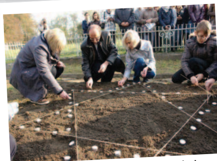
Gimnazjum Akademickie im. Krola Boleslawa Chrobrego in Nowy Sacz, Polonia