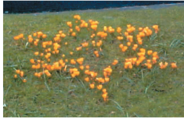
Crocus piantati a forma di Stella di Davide dagli allievi della St Martin’s Primary School, Garrison, contea di Fermanagh, Irlanda del Nord

I bulbi di crocus vanno piantati in autunno, da metà settembre a metà novembre. La primavera arriva in momenti diversi nei differenti paesi. Non ha molta importanza quando sbocciano i fiori, l’importante è che siano piantati in memoria dei bambini che morirono nell’Olocausto e che, quando spuntano i fiori, ci ricordiamo di loro.